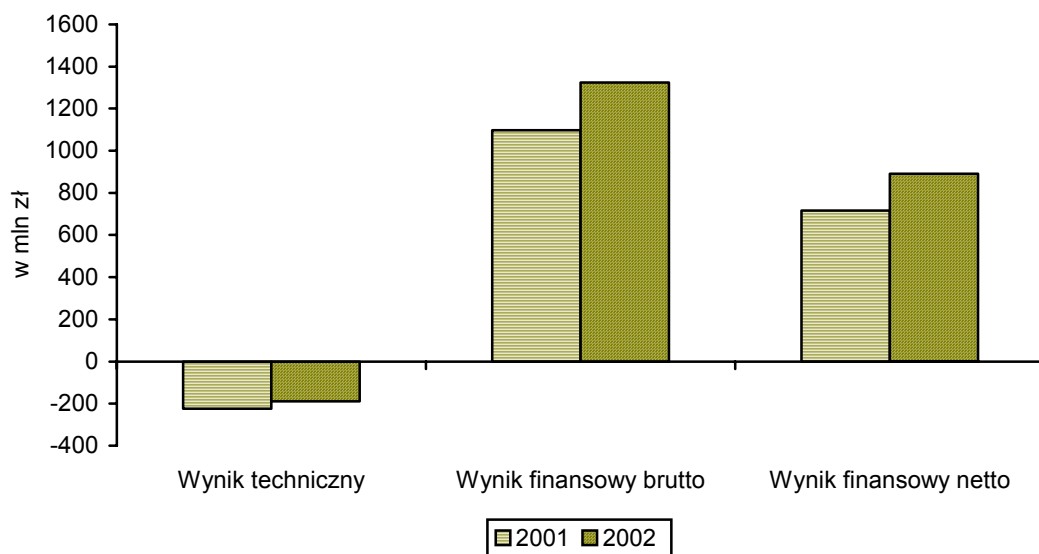
Wyniki finansowe ubezpieczycieli majątkowych