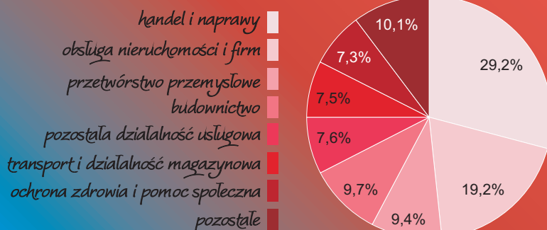
Podmioty gospodarki narodowej według sekcji PKD 2007